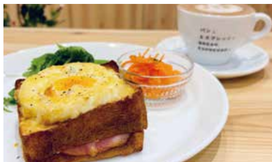
クロックマダムー セット

今日の気分のパニーニを選べます。 はじめての味にチャレンジするのもよいかもかもしれません。