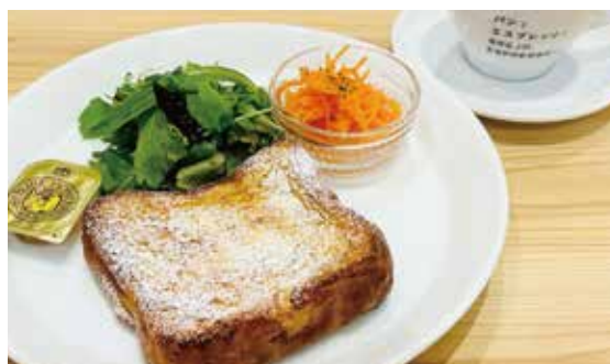
フレンチトーストセット

北海道ミルク100%でつくったフレッシュチーズと こんがり焼いたムーがよく合うので、食べる手が止まりません。