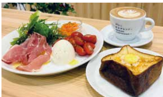
フレッシュチーズとトーストセット