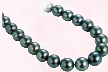
■ 黒蝶真珠ネックレス (8.0mm-11.7mm) ◎ 435,600円の品 198,000円