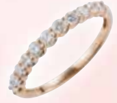
■ 18金ピンクゴールド製 ダイヤモンドリング (D 0.50ct) ◎ 319,000円の品 157,300円