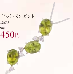
■ K18WGペリドットペンダント (P 4.48ct, D 0.19ct) ◎ 495,000円の品 175,450円