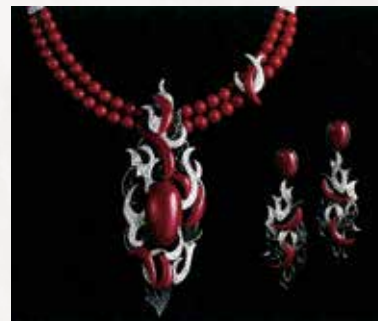
Oxblood Red オックスブラッドレッド

高知県沿岸の土佐湾沖で採取される濃い透明感のある赤色のサンゴは「血赤サンゴ(オックスブラッドレッド)」と呼ばれ、その美しさと希少性から宝石珊瑚究極のカラーとされています。