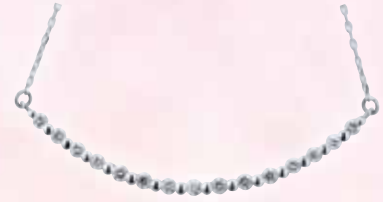
■ プラチナ製 ダイヤモンドネックレス (D 0.30ct) ◎ 203,500円の品 96,800円