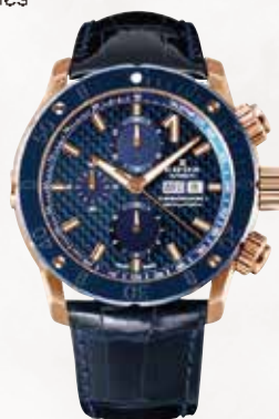
CHRONOGRAPH AUTOMATIC クロノオフショア1 クロノグラフ オートマティック