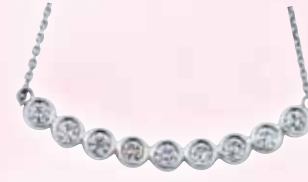
■ プラチナ製 ダイヤモンドネックレス (D 0.50ct) ◎ 374,000円の品 187,550円