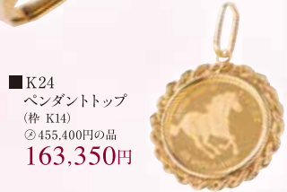
■ K24 ペンダントトップ (枠 K14) ◎ 455,400円の品 163,350円