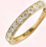
■ 18金製 ダイヤモンドリング (D 0.50ct) ◎ 297,000円の品 145,200円