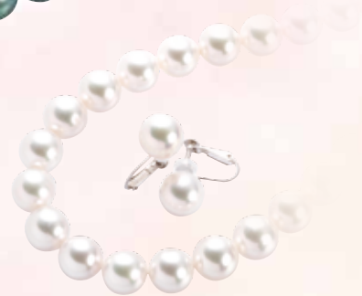
■ アコヤ真珠 2点セット (8.5mm-9.0mm) 【鑑別書付】 ◎ 484,000円の品 220,000円