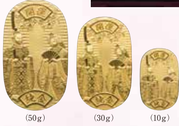
(50g) (30g) (10g)

細部に至るまでのこだわりが秀逸。お子様お孫様の未来が前途洋々たることを祈り祝う純金小判です。