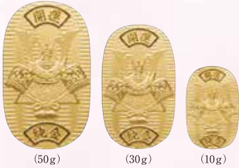
(50g) (30g) (10g)

男の子がたくましく育ち成長することを願う日本の伝統文化を寿ぐ吉祥品です。天空を勇壮に駆け巡るさまが限りない運氣上昇を招くとされます。