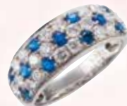
■ Ptアウイナイトリング (AU 0.39ct, D 0.82ct) ◎ 1,287,000円の品 471,900円