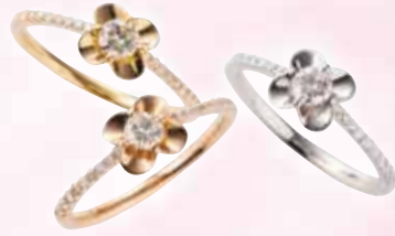
■ K18/K18PG/Pt ダイヤモンドリング (D 0.30ct) ◎ 各327,800円の品 各139,150円