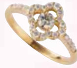
■ K18ダイヤモンド リング (D 0.205ct, 0.25ct) ◎ 547,800円の品 199,650円