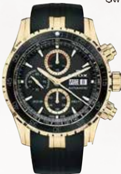
CHRONOGRAPH AUTOMATIC グランドオーシャン クロノグラフ オートマティック