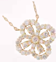
■ K18ダイヤモンド ペンダント (D 0.80ct) ◎ 473,000円の品 181,500円

内臓のバネで外れ磁石と溝でカチッと止まる安心・簡単クラスプ。※別途ワイヤー交換が必要になります。