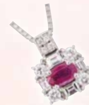
■ Ptルビーペンダント (R 0.409ct, D 0.555ct) ◎ 825,000円の品 326,700円