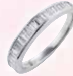
■ プラチナ製 ダイヤモンドリング (D 0.65ct) ◎ 605,000円の品 314,600円