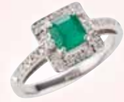
■ Ptエメラルドリング (E 0.625ct, D 0.21ct) ◎ 797,500円の品 302,500円